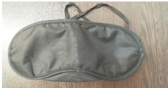
شکل ۲: چشم‌بند برای حالت ۳ و ۴ از آزمون تعادل

آزمون ۱ فرم A مقیاس ۲ آزمون هوش کتل در حقیقت خاصیت دست‌گرمی دارند، بنابراین، ۳ سؤال اول این آزمون حذف شد و پس از آن تجزیه و تحلیل آماری نتایج به‌دست آمده حاصل از ۴۳ سؤال بر روی ۴۰۰ آزمودنی، انجام شد که ضریب اعتبار آلفای کرونباخ برای ۴۳ سؤال باقی‌مانده برابر ۰/۷۸۹ به‌دست آمد که نشان‌دهنده اعتبار بالا و قابل قبولی بود.