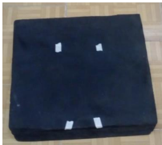
شکل ۳: برای حالت ۲ و ۴ از آزمون تعادل

برای مثال با بستن چشم‌ها و هایپراکستنشن ۲ سر، سیستم عصبی مرکزی بیشترین تکیه‌ی خود را برای کنترل قامت روی اطلاعات ناشی از گیرنده‌های حسی پیکری خواهد داشت (سیدی و همکاران، ۲۰۱۵) (شکل شماره ۵). فوم و چشم‌بند هم از دیگر ضمایم دستگاه بایودکس می‌باشد که جهت دست‌کاری‌های سیستم‌های حسی مختلف استفاده شد (شکل شماره ۲ و ۳).