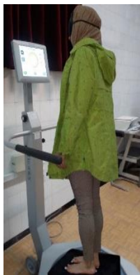
شکل ۵ ج: حالت ۳ با تداخل بینایی و دهلیزی

حالت ۳: وضعیت ایستاده روی دو پا در سطح پایداری ۱۲ و با چشم‌های بسته با پد چشم‌بند و با حرکت هایپراکستنشن سر که داده‌های بینایی و دهلیزی مختل شده و از داده‌های سیستم حسی- پیکری برای کنترل قامت استفاده می‌شود (شکل ۵ ج).