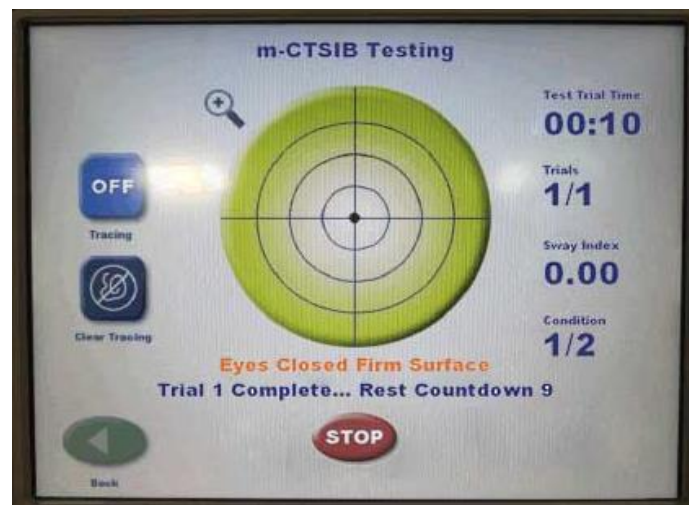
شکل ۱: آزمون بالینی اصلاح شده یکپارچگی حسی در تعادل (M-CTSIB)

این تحقیق از نوع نیمه تجربی و به لحاظ هدف، کاربردی بود. طرح تحقیق از نوع پیش‌آزمون و پس‌آزمون با یک گروه تجربی و یک گروه کنترل بود.